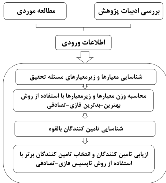
شکل ۱. چارچوب کلی تحقیق حاضر.

بهترین-بدترین فازی-تصادفی با در نظر گرفتن سناریوهای مختلف توسط محققین توسعه داده شده است.